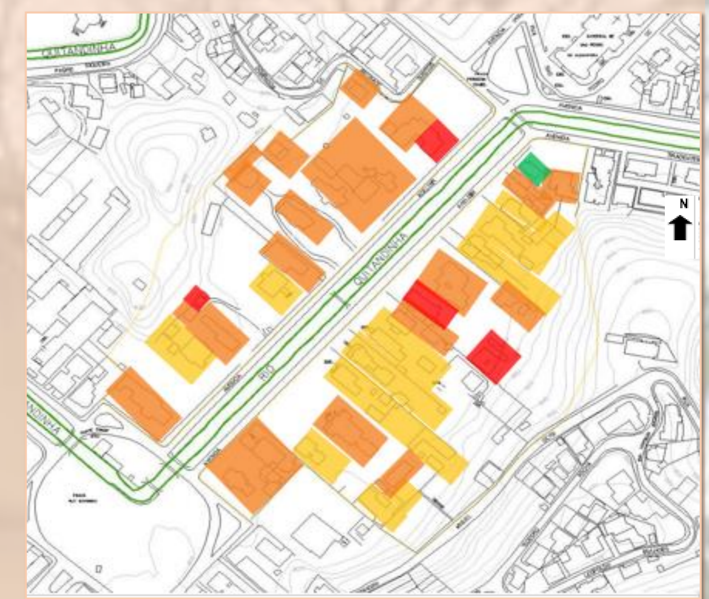
4- Mapa de gabarito