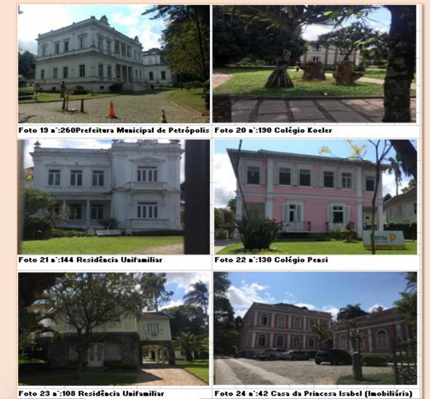
2- Foto de algumas edificações da Avenida Koeler