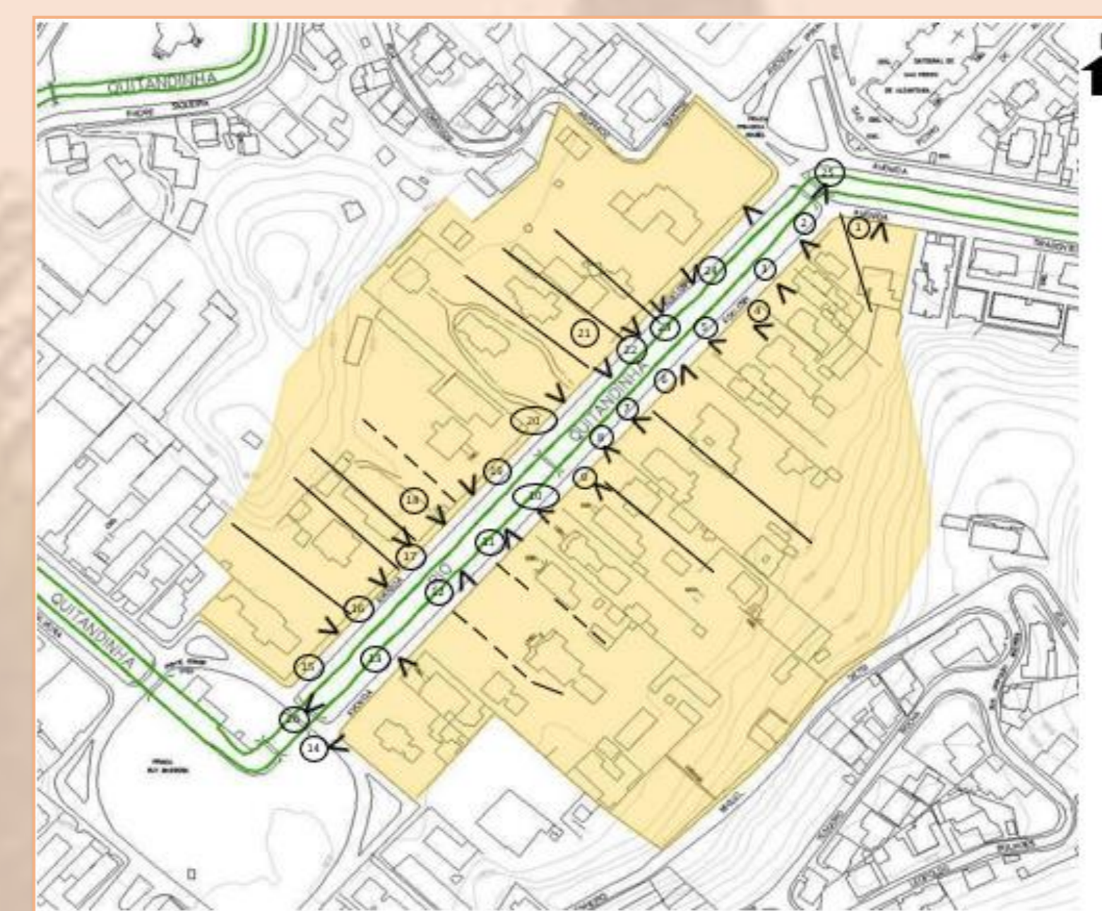
1- Mapa de visadas Indicação do local das fotos tiradas para o levantamento da ficha