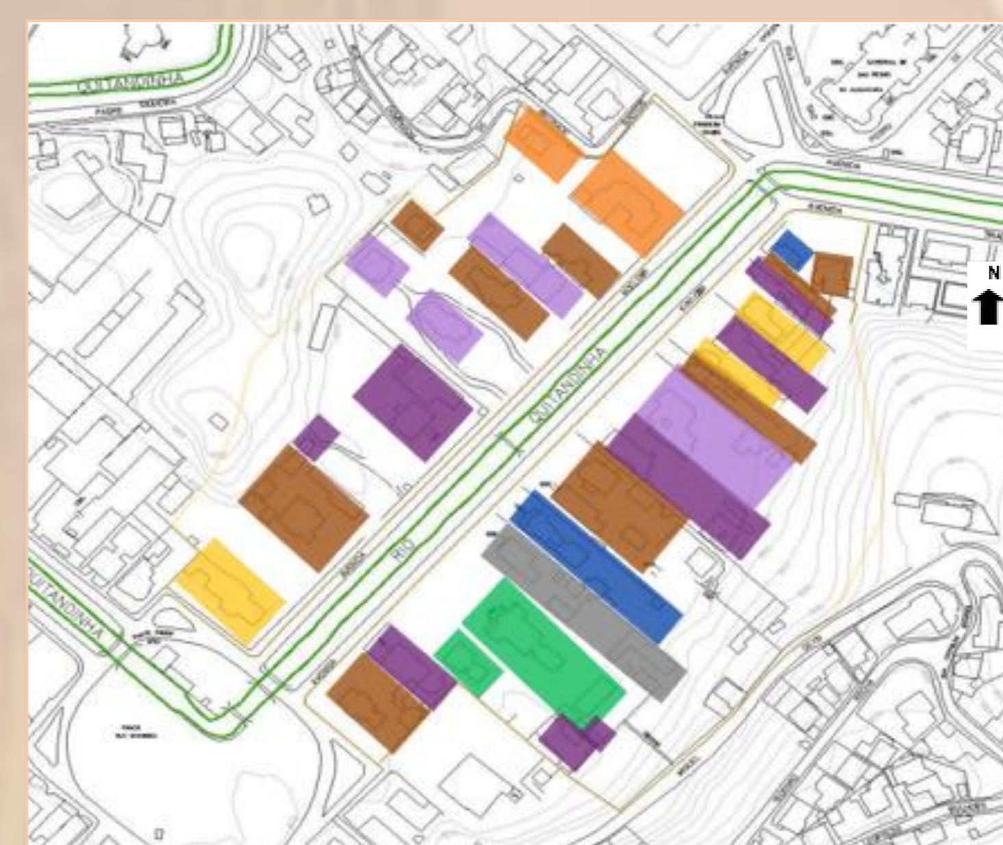
3- Mapa de uso e ocupação do solo